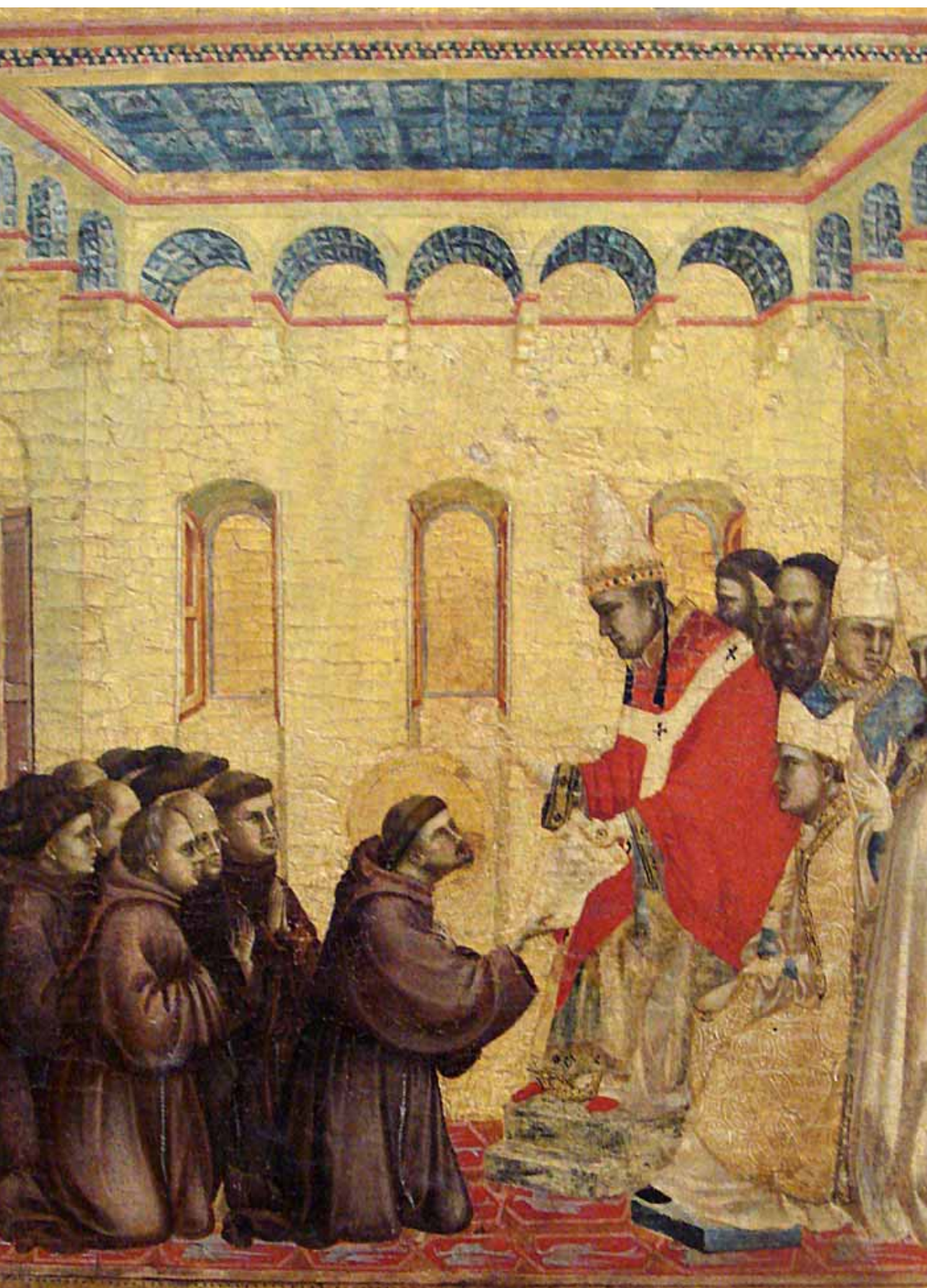
Una immagine iconica che spiega più di mille parole: l'approvazione della Regola di san Francesco da parte di papa Innocenzo III (Giotto, Museo del Louvre, Parigi)

agiografiche e funzionali al culto le seconde. Senza contare gli scritti di pugno dello stesso Francesco e la Regola lasciata in eredità ai frati. Il rapporto con la gerarchia ecclesiale, con Chiara e con i seguaci è affrontato da Barbero attraverso frammenti delle fonti e citazioni di testi senza perdere il gusto della narrazione accessibile, ma riportando nel giusto solco interpretativo l'aneddotica che voleva il santo parlare con gli animali o cercare di "convertire" il Sultano. Tra episodi di acredine e storie di miracoli, tra contraddizione e ammirazione, la rivoluzione di colui che diventerà il patrono d'Italia è chiara; aver rammentato alla Chiesa ufficiale, segnata a quei tempi da corruzione, lussuria e arricchimento materiale, che Cristo aveva un unico messaggio: l'amore praticato attraverso povertà e carità.