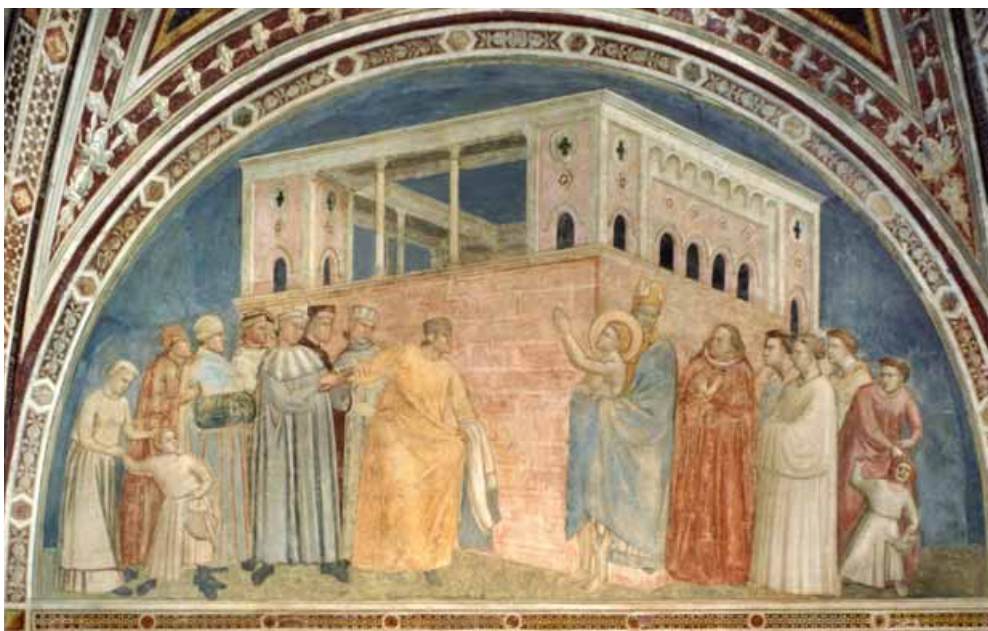
San Francesco rinuncia alle vesti davanti al vescovo Guido e al padre Bernardone (Giotto, Basilica di Santa Croce, Firenze)