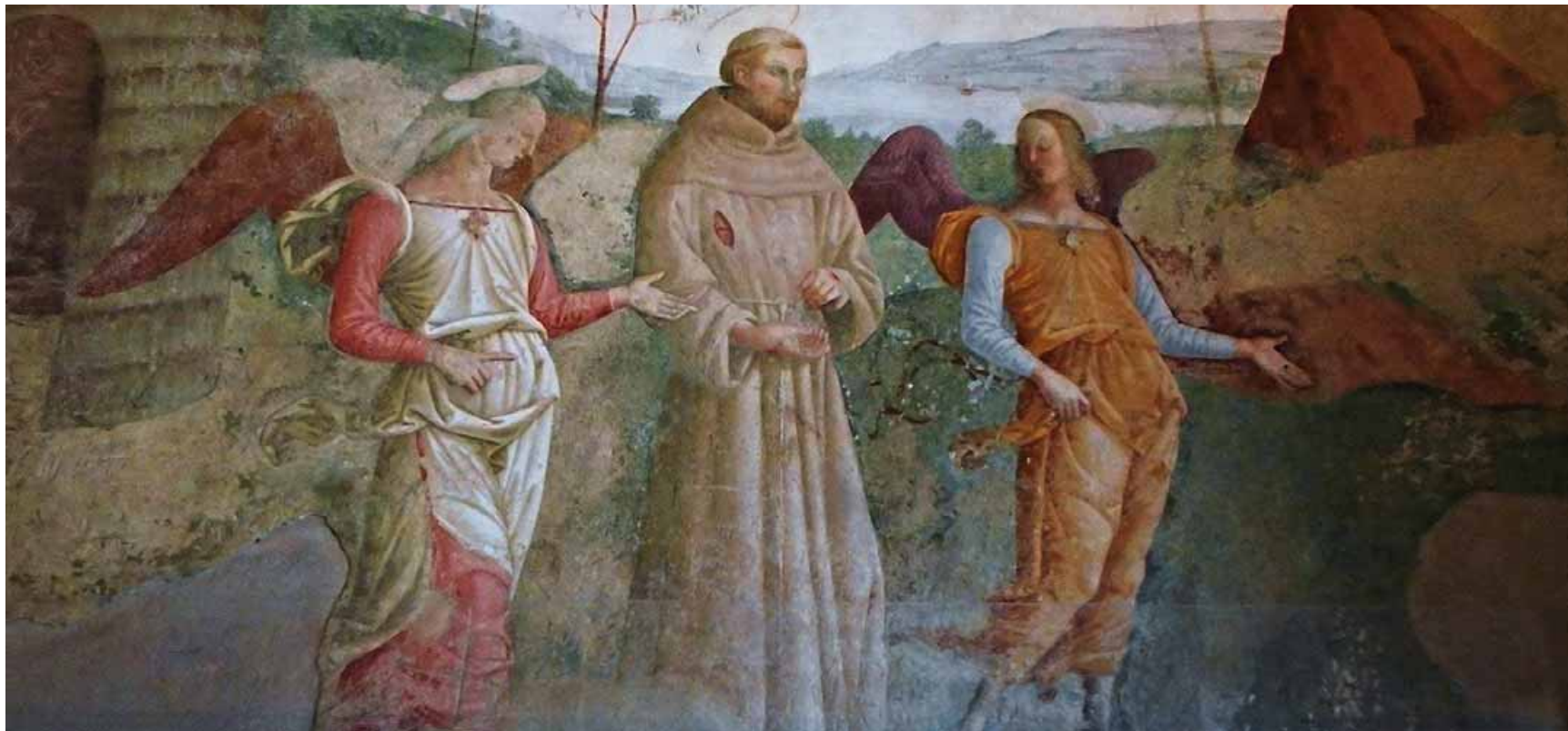
San Francesco va alla Porziuncola (Storie di San Francesco, Tiberio d'Assisi, Convento di Santa Maria degli Angeli). A pagina 10: l'estasi di san Francesco (Giotto, Basilica superiore di Assisi)