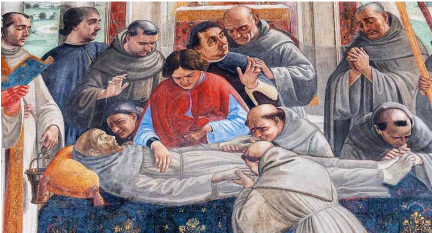
Morte di san Francesco (ciclo di affreschi con le Storie di san Francesco d'Assisi di Domenico Ghirlandaio. Cappella Sassetti nella chiesa della Santa Trinità a Firenze)