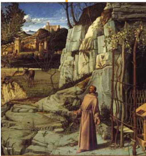
San Francesco in estasi nel deserto (Giovanni Bellini, Frick Collection di New York)

In questo tour della memoria per impadronirci del Francesco non agiografico, bensì del santo dell'amore incondizionato per il Vangelo, abbiamo lasciato da parte la biografia, per raccontarlo senza spiegazioni dotte. Francesco parla al cuore