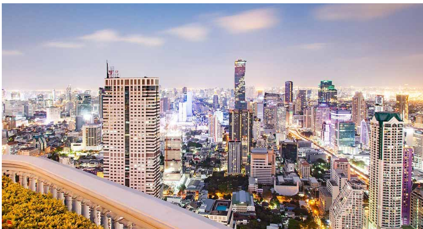
Panorama di Bangkok, la capitale della Thailandia

Mentre i centri economici dell'Europa e del Nord America registrano una crescita contenuta, la regione Apec si muove a velocità doppia nella crescita e nella trasformazione condivisa