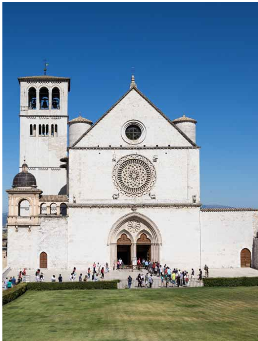
La Basilica di San Francesco, ad Assisi

1226: tra il 3 e il 4 ottobre, a 44 anni, il poverello muore alla Porziuncola. Due anni dopo, viene canonizzato in Assisi da papa Gregorio IX. Nel 1230, infine, il corpo del santo viene traslato da San Giorgio alla nuova basilica di San Francesco in Assisi.