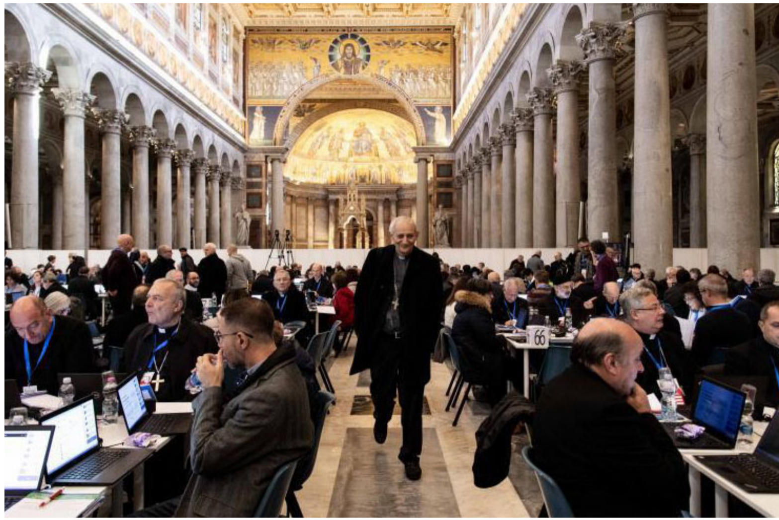
Roma, Basilica di San Paolo, 15 novembre 2024: il cardinale Zuppi, presidente della Cei, fra i partecipanti alla Prima Assemblea sinodale delle Chiese in Italia

Tra concretezza e novità: viene ribadita con forza la necessità di dare attuazione alle scelte magisteriali dei documenti ecclesiali, superando lentezze e resistenze e riconoscendo le buone prassi per diffonderle sui territori.