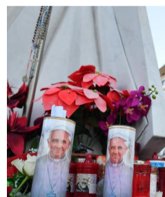
Pregando per il Papa

La Chiesa come ospedale da campo: è una delle