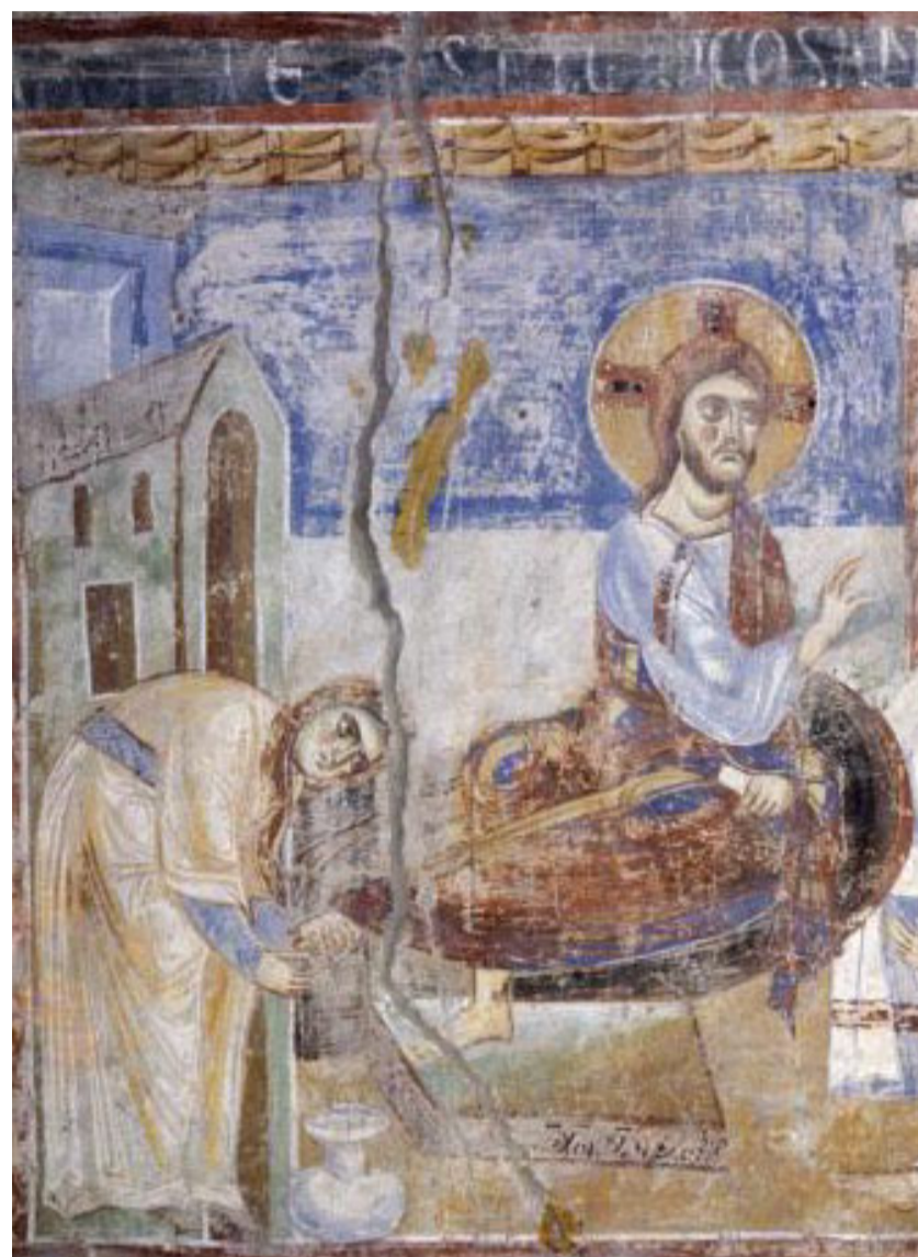
Abbazia di Sant'Angelo in Formis. Maria asciuga i piedi di Gesù con i suoi capelli