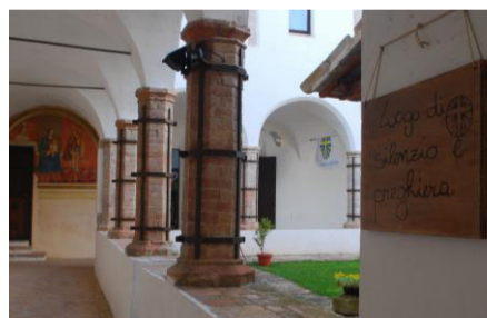
Casa San Girolamo, polmone spirituale dell'Acr

Un percorso che guarda a tutti, per avvicinarsi alla Pasqua con un cuore lieto, che possa accogliere la speranza che viene dal Signore Risorto.