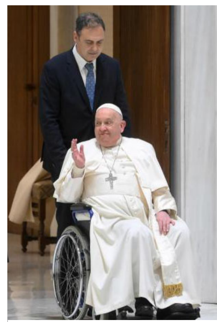
Il sorriso di papa Francesco