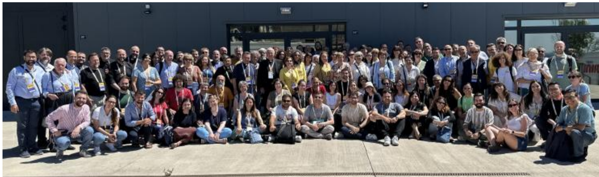
La Settimana sociale dei cattolici in Italia, che si è svolta a Trieste lo scorso luglio, ha visto la partecipazione di numerosi soci di Ac

Coordinamento redazionale Gianni Di Santo