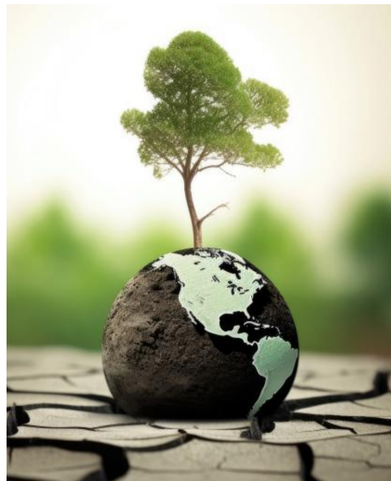
Maecenas semper venenatis aliquam. Cras pharetra, massa laoreet

preoccupante arriva dagli indicatori quantitativi, introdotti per la prima volta nel rapporto di quest'anno. Questi indicatori coprono temi cruciali come la povertà, l'educazione, la salute e l'economia. Dei 37 indicatori analizzati, ben 22 mostrano che l'Italia non riuscirà a raggiungere i target prefissati. Questo dato ci obbliga a riflettere seriamente sulla necessità di un cambio di passo. Gli obiettivi dell'Agenda 2030 sono davvero ancora all'ordine del giorno? Posso affermare che l'Agenda 2030 resta un riferimento fondamentale per molti Paesi, come ad esempio la Spagna, che ha continuato a lavorare con convinzione in questa direzione. È vero che eventi globali come la pandemia, le guerre e l'inflazione hanno rallentato alcuni progressi, ma non possiamo permetterci di abbandonare la strada tracciata. Gli Obiettivi di Sviluppo sostenibile rappresentano il quadro più ambizioso e completo che il mondo abbia mai adottato per affrontare le sfide globali. Inoltre, l'Agenda 2030 è diventata un linguaggio condiviso e utilizzato da governi, imprese, organizzazioni del terzo settore e cittadini. Nonostante le difficoltà, deve continuare a essere la no-