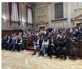
Un folto pubblico per il Convegno Mlac

Dal Mlac, vent'anni di sfide e opportunità nel segno della Dottrina sociale della Chiesa. Lo sguardo verso un futuro dove la dignità della persona sia al centro di ogni cammino di cambiamento