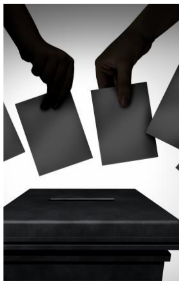
La politica è partecipazione / lcp