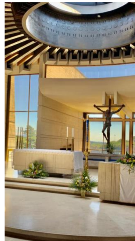
La chiesa di San Melchiade al Labaro, a Roma