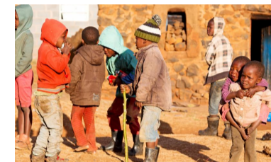
La compassione parte dall'Africa